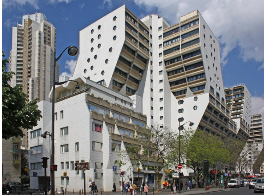
Мартин ван Трек жилой комплекс “Органы Фландрии”

Он состоит из четырех жилых башен на 1950 квартир (в самой высокой 39 этажей и 123 м) и еще нескольких корпусов пониже с магазинами, детским садом, домом престарелых и прочей инфраструктурой. Здания имеют узкое основание и расширяются кверху. Он взял за образец органые трубы — отсюда и название комплекса, и имена башен — «Прелюдия», «Фуга», «Кантата» и «4». На этом проекте архитектор впервые использовал эндоскоп, за что потом получил звание изобретателя архитектурной эндоскопии.