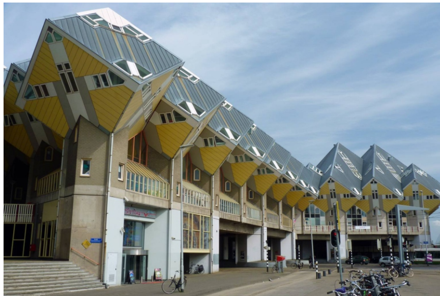
Пит Блом “Кубические дома”

Радикальным решением Блома было то, что он установил куб дома не на грань, как обычно, а на вершину, и этой вершиной он опирается (зрительно) на шестигранный пилон. С высоты комплекс имеет замысловатый вид, напоминающий невозможный треугольник. Стены и окна по отношению к полу наклонены под углом в 54,7 градусов. Общая площадь квартиры составляет около 100 квадратных метров, однако около четверти пространства является непригодным для использования из-за наклонных стен.